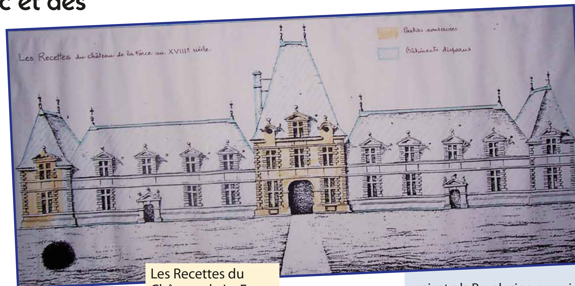
Les Recettes du Château de La Force, au XVIII e siècle

Au milieu de XIX e siècle, les deux ailes servant d'écuries, appelées plus communément « Les Recettes » sont détruites par des tempêtes et incendies successifs. Aujourd'hui il ne reste plus que l'entrée du Pavillon des Recettes et le temple protestant attenant. Cet ultime vestige du château, demeure la propriété du quatorzième Duc de La Force.