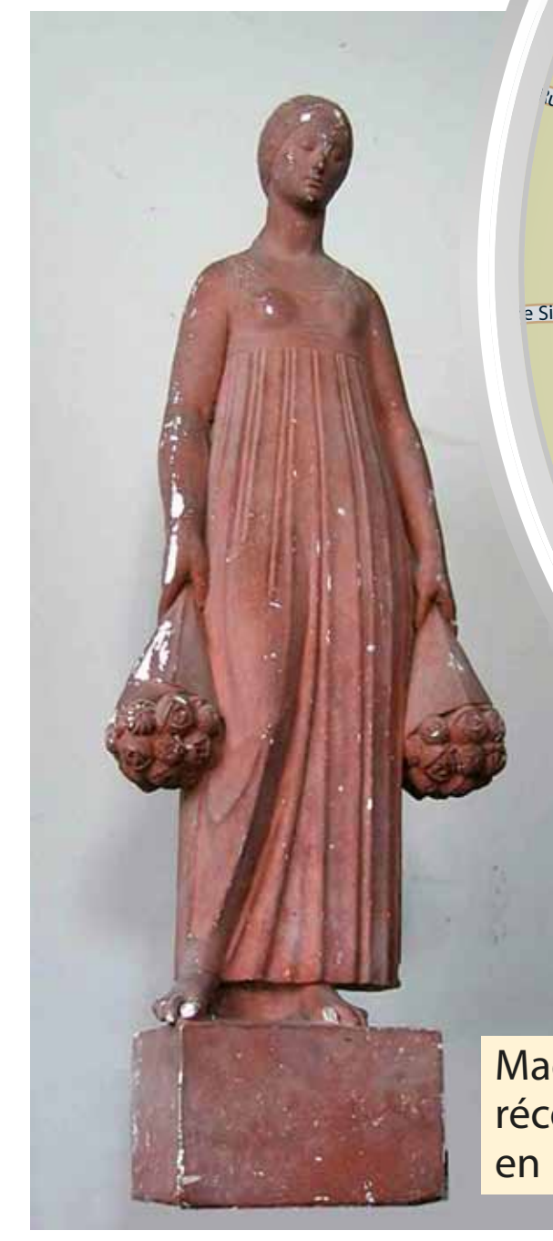
Maquette récompensée en 1924

L'emplacement prévu consiste en un petit carré de terrain situé sur l'angle des Allées et de la route départementale n°34 de Bergerac à Montpon. Au dernier trimestre 1925 on réalise l'inscription des 46 noms de soldats morts et on plante les arbres nécessaires à l'entourage du monument. L'inauguration aura lieu le 24 mai 1926. Le monument a été déplacé dans un lieu de mémoire face à la mairie en octobre 2009.